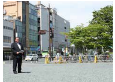
盛岡バスセンター跡地現地調査