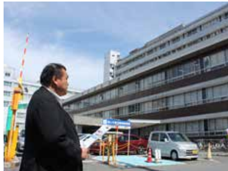
岩手医大附属病院移転現地調査