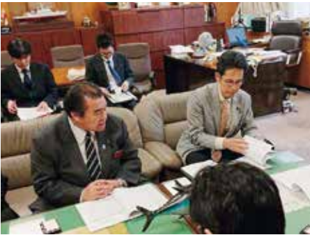
階代議士と国への要望