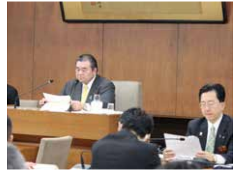
予算特別委員会委員長就任 (2019年2月)