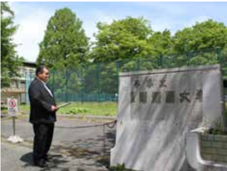
盛岡短大跡地現地調査