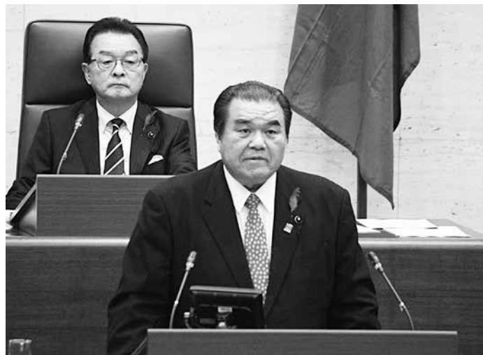
12月5日(水)、一般質問に登壇いたしました。