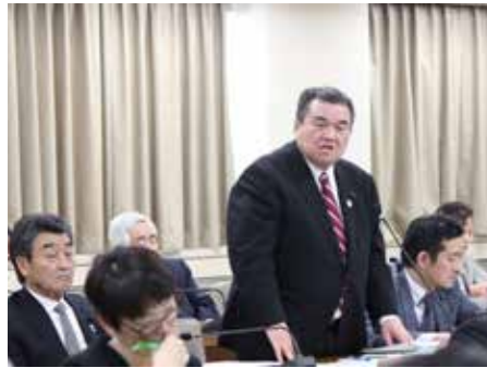
次期総合計画調査特別委員会質疑