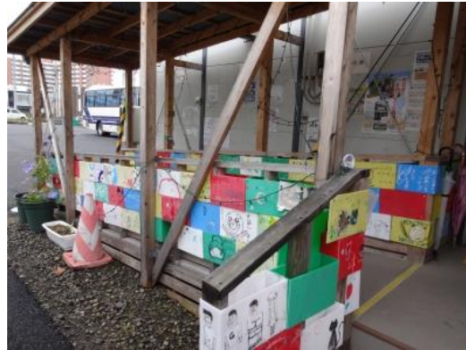
(集会所の通路にある子供たちの作品)