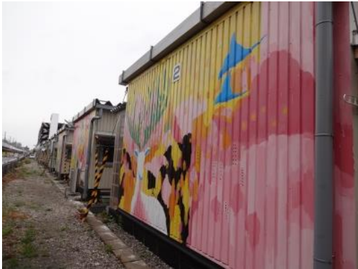
(あすと長町仮設住宅の壁面アート新幹線など車窓に面して)

においても今後の取り組みに参考としていくことを考えております。午後は名取市閑上地区にて震災津波被害復興祈念資料館「閑上の記憶」の運営状況について調査いたしました。尊い犠牲が伴った経験を後世に伝承していくことや犠牲になられた皆様の慰霊と失った記憶や感情の整理をする場所でもありました。地震と津波を忘れることなく、命を守るための行動を伝えていく大切さをあらためて強く感じました。今回の調査で知ることが出来た現実をしっかり受け止め、今後の取り組みに活かしていかなければなりません。皆さまのコメントをお待ちしております。軽石 栞