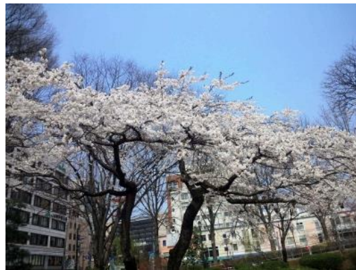
(第85回メーデーのローガンです) (4/26の桜が満開です。本日まであれば・・・)

がんばろう！岩手 がんばろう！岩手 がんばろう！岩手 がんばろう！岩手 がんばろう！岩手