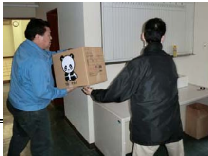
■ 働く仲間へ支援物資を届ける