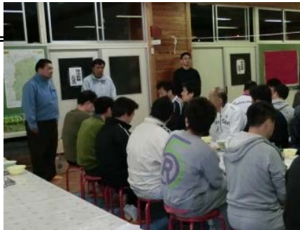
■ ボランティアセンター

また、大震災発生直後から被災しながらも早期の電力復旧に向けて、昼夜問わず努力をされた皆様に対して、4月15日から20日にかけて組合役員とともに宮古市、釜石市、大船渡市の現場を訪問し、職場の仲間から提供いただいた支援物資の配達と現地で復旧作業にあたっている皆様に激励を行いました。