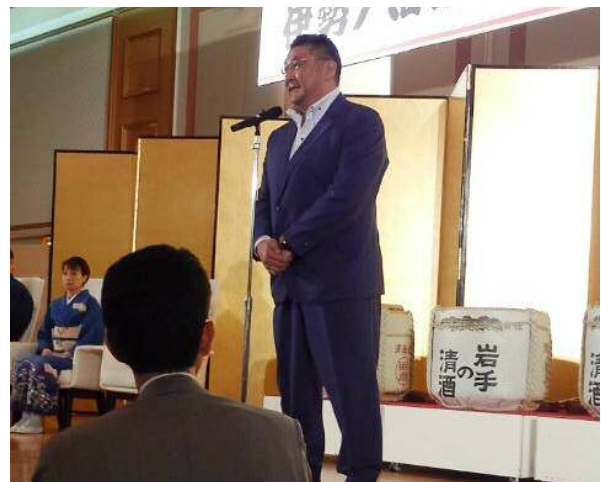
伊勢ノ海部屋親方からのご挨拶・後ろ姿は階代議士です

がんばろう！岩手 がんばろう！岩手 がんばろう！岩手 がんばろう！岩手 がんばろう！岩手