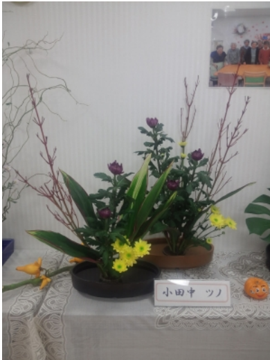
(103歳の見事な作品です。)

本日は、ある施設の文化祭にお邪魔してまいりました。103歳の見事な生け花にびっくりいたしました。しっかりと生きている皆様の元気を拝見してまいりました。健康で生きがいを持った人生にするために頑張ります。そのあとに全国シンポジウムに出席してまいりました。やはり、情報を得る機会があることは大切です。本日の情報をさらに掘り下げていき、県政に活かしていく所存であります。皆様のコメントをお待ちしております。軽石 拝