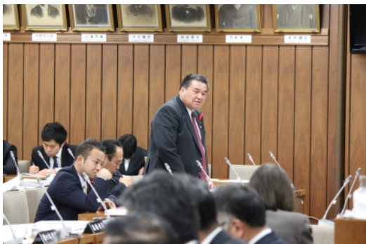
(決算特別委員会にて質問しております。)

本日は秋晴れの気持ちいい天気です。行楽日和の土曜日となり、各種行事が開催されております。各行事のご盛会をお祈りいたしております。昨日も県議会は決算特別委員会により部局審査が行われました。私は、保健福祉部の審査におきまして、ドクターヘリ運航などに関してと難病の重度障がい児・者の現状と課題などについて質疑を交わしました。やはり現状をしっかりと把握したうえで事業を進めなければ、現場に即した政策の実現と成りえないことをおらためて感じました。また、復興関連事業における疑問点が多く指摘されております。今後の審査にも影響がありそうです。来週もしっかり審査していく所存であります。皆様のコメントをお待ちしております。軽石 拝